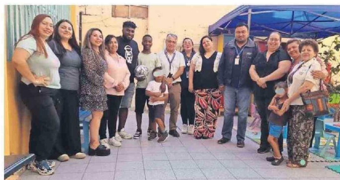
LA EMOTIVA DESPEDIDA EN LA RESIDENCIA FAMILIAR ANTES DE VIAJAR A SANTIAGO.