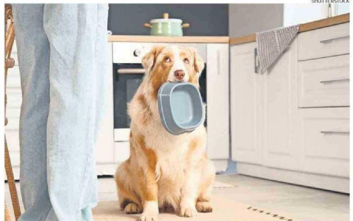
LOS PLATOS DE COMIDA ALOJAN MICROORGANISMOS Y RESIDUOS.