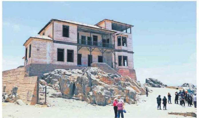
UNO DE LOS PASEOS DESARROLLADOS FUE EN LA LOCALIDAD DE GATICO.