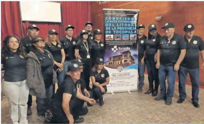
LOS INTEGRANTES DE LA AGRUPACIÓN SOL Y DESIERTO DE TOCOPILLA.