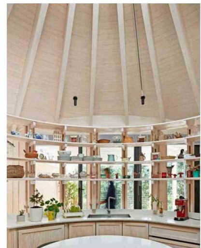
Casa en Nonguén. Estructura de madera laminada Lamitec y revestimientos y puertas de pino finger.