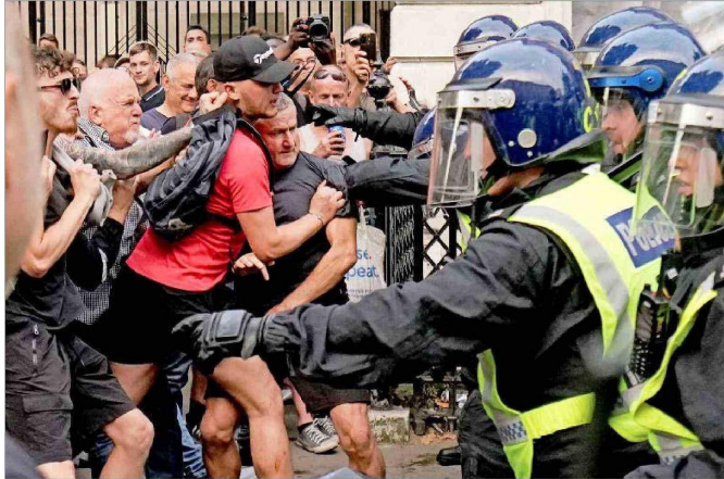
LOS MANIFESTANTES se enfrentaron con la policía en ciudades de todo el Reino Unido.

El detonante de las protestas fue el apuñalamiento de tres niñas en Southport, al noroeste de Inglaterra, en el que ocho meno-