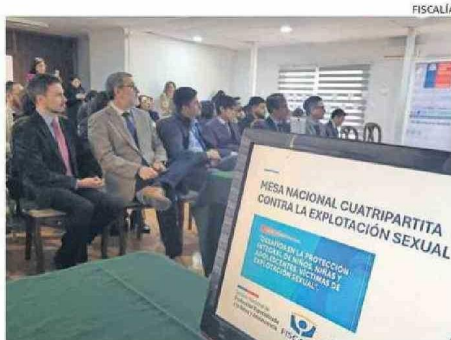
LA ACTIVIDAD DE LA FISCALÍA.