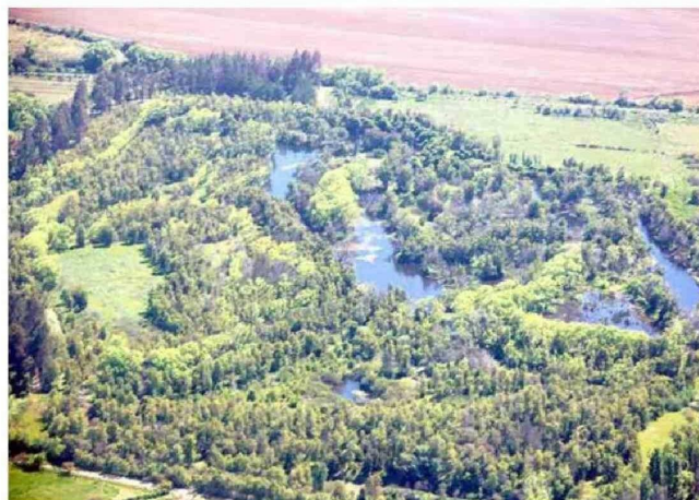
La forestación se hizo principalmente con plantas representativas del bosque esclerófilo del Maule, especies con mayor tolerancia a la sequía.

darle en su proyecto y por supuesto tomé el reto. Le señalé de inmediato, que lo principal y urgente eran las plantas para iniciar la reforestación, asunto no menor porque deben hacerse con bastante anticipación", recuerda el magister en Cambio Climático y Recursos Vegetaciones.