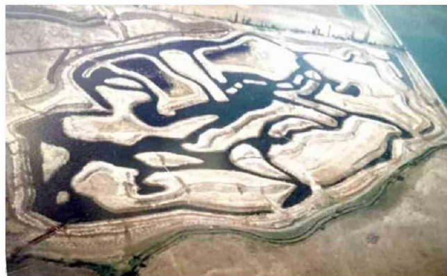
Imagen del año 2000 con el terreno canalizado y previo a ser forestado con un promedio de 1.300 árboles por hectárea, donde hoy abunda el Quillay, Maitén, Boldo, Peumo y Hualo, además del avistamiento de cisnes de cuello negro.