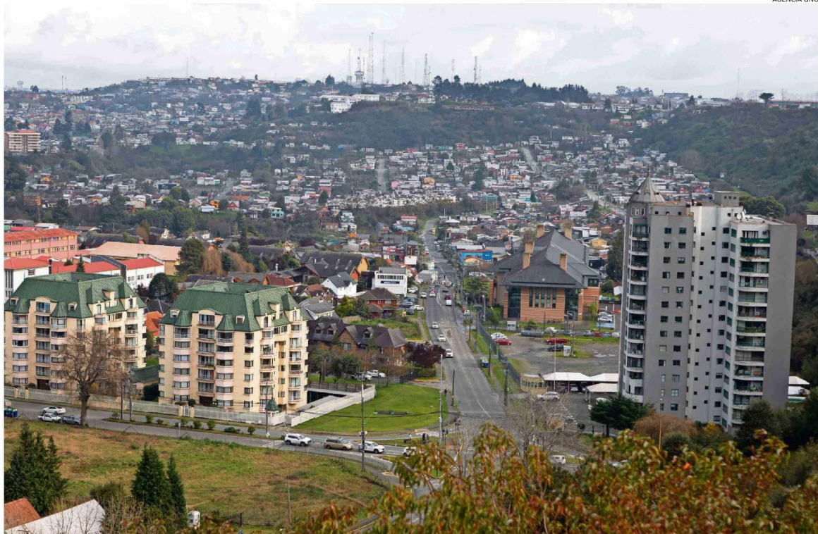
EL ALCALDE DE PUERTO MONTT, GERVOY PAREDES, PROYECTA QUE LA COMUNA LLEGARÁ A LOS 280 MIL HABITANTES EN ESTE CENSO.

Entonces, admite, “se observa el cambio en cuanto a la cantidad de personas que habitan el territorio. Pero no se tiene el dato duro. Por ello, el Censo entregará las certezas que nos permitirán ir adecuando las necesidades de cada territorio, de manera que el plan de inversiones sea ajustado en