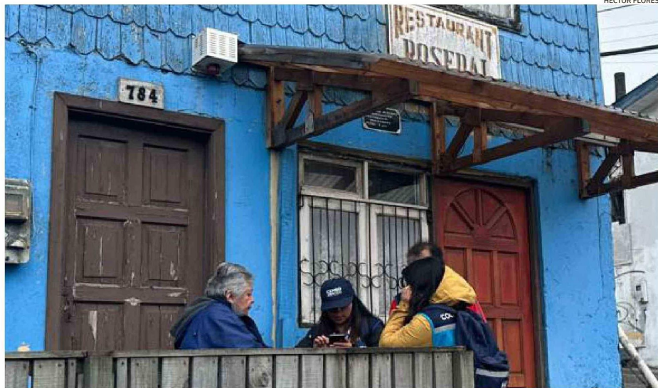
CASTRO ES UNA DE LAS COMUNAS DONDE EXTENDIÓ EL CENSO POR UN MES Y DONDE SE PROYECTA UN CRECIMIENTO POBLACIONAL.