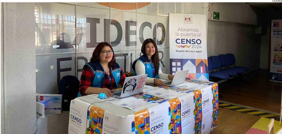
LA FASE EN TERRENO DEL CENSO EN 26 COMUNAS DE LA REGIÓN CONCLUYÓ ESTA SEMANA. AHORA LOS INTERESADOS PUEDEN ACERCARSE A PUNTOS HABILITADOS, PARA REALIZAR EL TRÁMITE SI ES QUE NO LO HAN EFECTUADO.