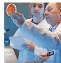
El parche en fase de prueba.

"Estudiamos las propiedades antimicrobianas de ciertas proteínas de origen bacteriano, así como también propiedades regenera-