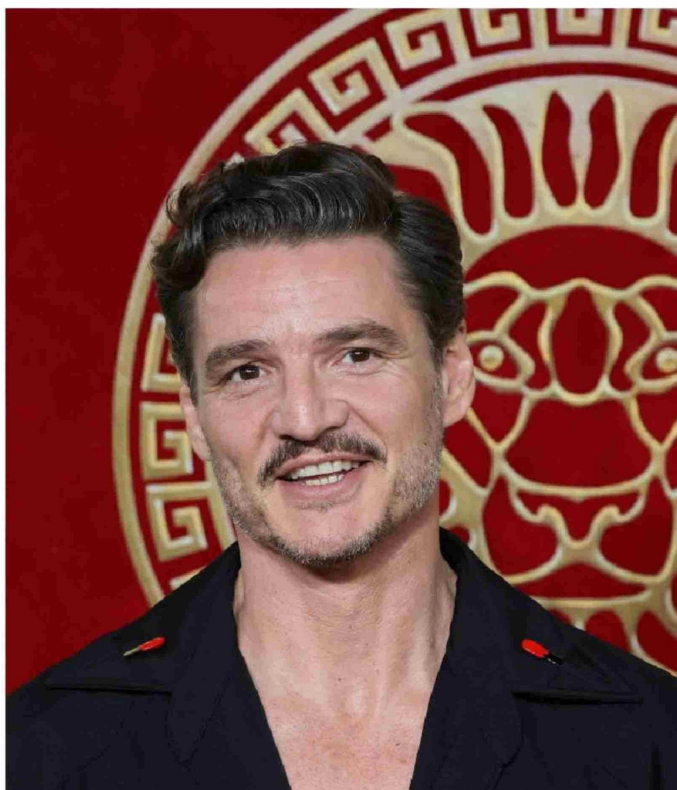
► La figura de Pedro Pascal ha sido clave en la industria del cine y del streaming.

Entre sus más de cuarenta papeles, elegir cuál es el mejor es complejo. Sin embargo, los críticos coinciden en que Pedro Pascal brilla más en televisión que en cine. "Es difícil elegir un solo rol, porque su carrera ha sido increíblemente diversa, tanto en cine como en televisión. Si tuviera que elegir un top tres, me quedaría con sus roles televisivos", dice Sol Márquez. Así, se arriesga y elige las interpretaciones en The Good Wife, Juego de Tronos,