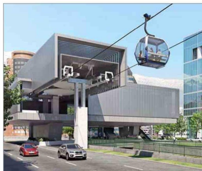
MOP El teleférico promete movilizar a tres mil pasajeros por hora.

Canal San Carlos, la instalación de faenas en el Punto de Quiebre y avances significativos en las estaciones Parque Metropolitano y Santa Clara, junto con las obras en seis torres dentro del Parque Metropolitano.