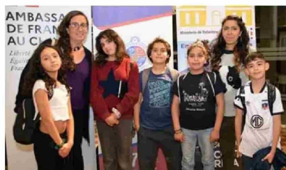
Alumnos de la Escuela El Bosque de Laguna Verde.