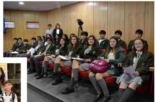
Alumnos del Colegio Seminario San Rafael.