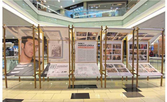
La exposición está disponible en uno de los pasillos del segundo piso, gracias a la alianza del centro comercial con Suena el Río Producciones y Concepción City of Music Unesco.