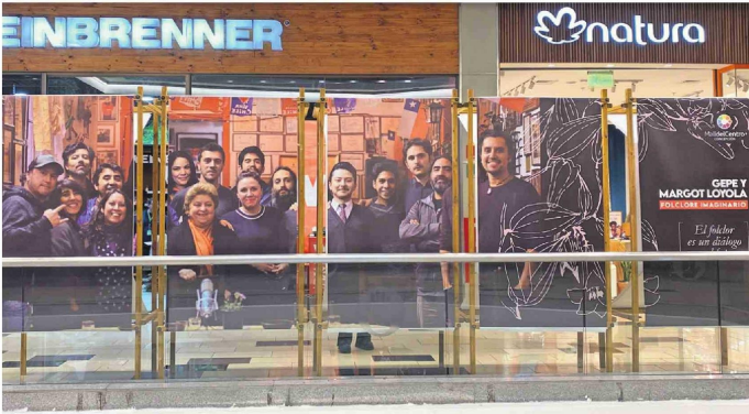
En la muestra hoy un link que dirige directamente al documental del penquista.