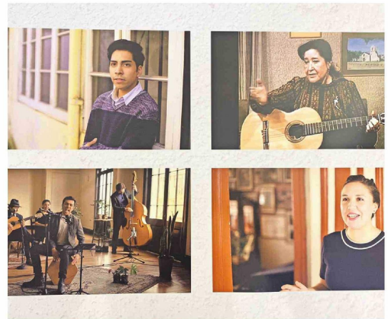
Entrevistas a personajes formados por ella también son parte de la exposición.

La muestra gráfica está disponible durante todo septiembre en el segundo piso de Mall del Centro.