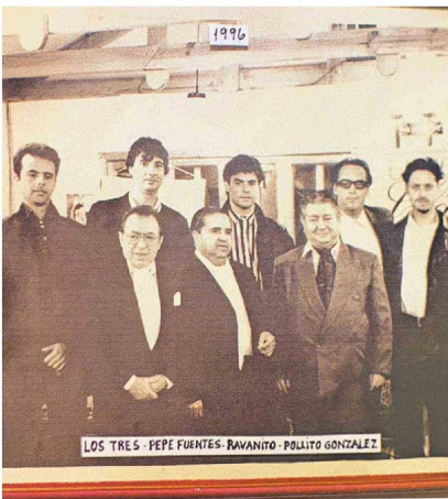
Unos jóvenes Los Tres también son parte de la muestra.