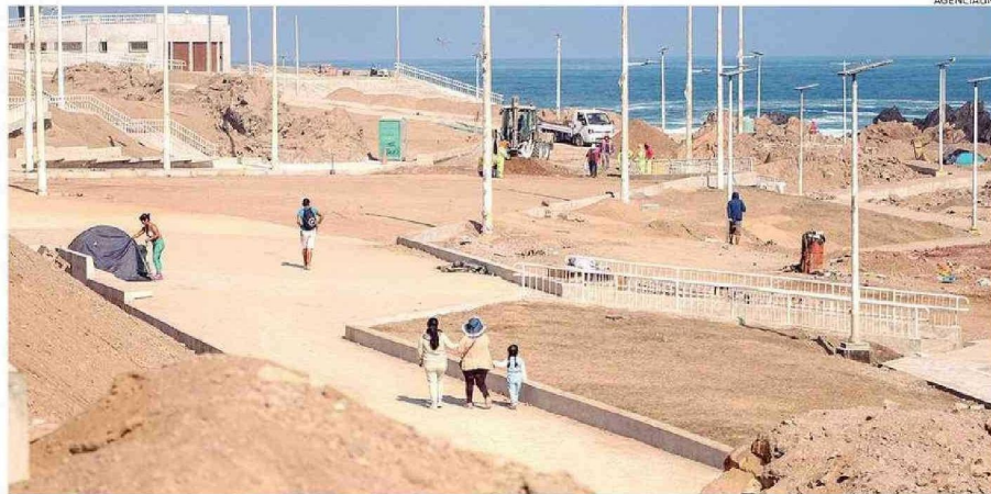
EL PROYECTO POSEE UNA INVERSIÓN CERCANA A LOS 14 MIL MILLONES.