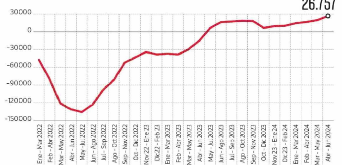
Desocupados según duración del desempleo trimestres abril-junio 2023 y abril-junio 2024 En número / var % anual