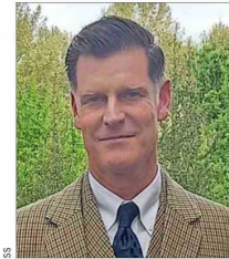
“Donoso representa jardines consumados”, dice el director del departamento de Literatura del Instituto de Letras UC.

y lo privado”. Finalmente, destaca las nuevas lecturas del autor a través de la intermedialidad, trabajos que leen narraciones de Donoso a la luz de películas y producciones visuales. “Eso me parece importante, porque lo visual a veces logra desestabilizar lo que entendemos por literatura”.