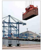
Durante la cumbre de APEC inauguraron el megapuerto de Chancay, construido con capitales chinos y con el que Perú intenta ser el principal centro logístico de la región. | B 6

Ascienden a $126 mil millones Fragmentación de partidos: Instan a agilizar reforma ante alza de más de 200% de reembolsos por gastos de campaña > Analistas llaman a impulsar un proyecto que aborde "las enormes facilidades que existen para constituir un partido". | C 5