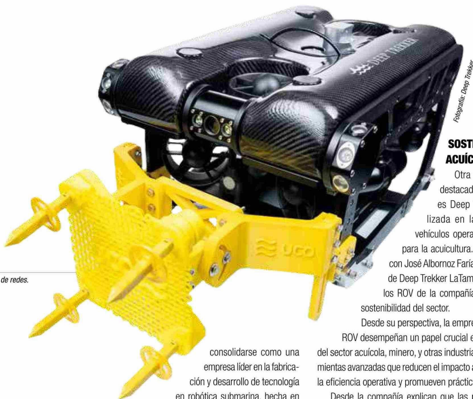
Reparación de redes.