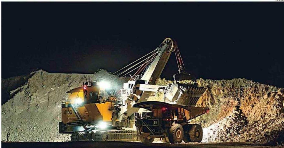
MINERA ZALDÍVAREMPLEA A CERCA DE 4 MIL PERSONAS.