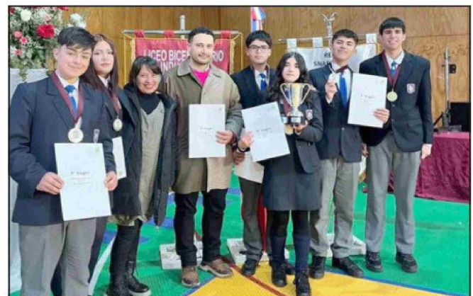
Equipo campeón de la Competencia de Debate de SNA Educa.