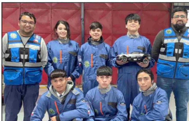
Equipo para el ‘H2 Grand Prix Chile’ de esta semana.