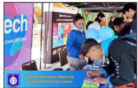
Feria Universitaria año 2023.