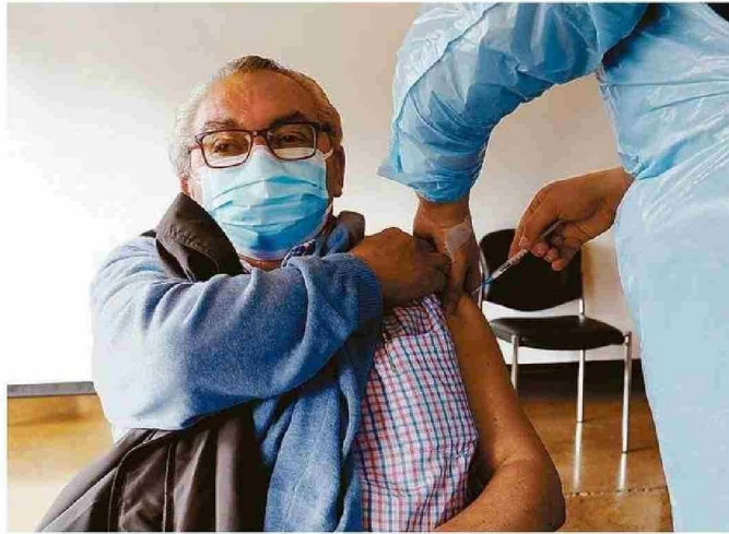
LA VACUNACIÓN FUE UN MOMENTO CLAVE PARA DETENER LOS CASOS GRAVES Y SUPERAR LA PANDEMIA.

fallecidos totales se han producido en Chile desde el inicio de la pandemia hasta el 1 de marzo de 2025.