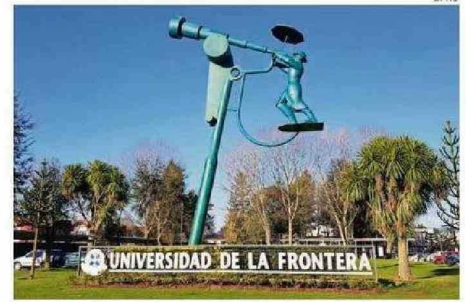
LA JUNTA DIRECTIVA CONFORMARÁ UN COMITÉ DE CRISIS QUE PERMITA INICIAR UN PROCESO ELECCIONARIO PARA UN NUEVO RECTOR O RECTORA.