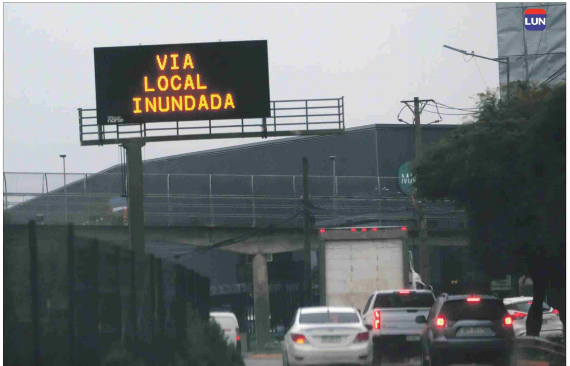
Las carreteras aguantan un poco mejor las lluvias, pero no pasa lo mismo con las calles locales.

En segundo lugar, prosigue Figueroa, "Santiago es una ciudad cordillerana", es decir, tiene una pendiente muy pronunciada que va de oriente a poniente. "Luego, cuando llueve, como el agua no es absorbida por la tierra porque la llenamos de concreto, el agua escurre. ¿Hacia dónde? Hacia abajo, por supuesto, hasta llegar a las zonas bajas de la ciudad. Y ahí se producen los problemas más importantes: Lampa, Maipú, Quilicura, Pudahuel, La Florida, aunque ha mejorado bastante. Todas esas zonas se inundan".