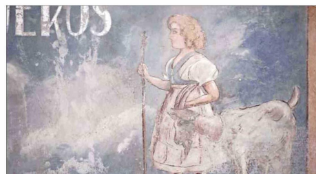
Melanie Smith, "Locos y lapas" (2024), video, 27 min.

Varios siglos después, Melanie Smith (Poole, 1965) —artista británica que vive en Ciudad de México y Londres— hace una operación similar de ocupación, salvataje y piratería en la sala principal del Bodegón Cultural de Los Vilos donde encalló con su video-instalación. Allí construye una pequeña vivienda con material ligero, inunda el espacio de luz azul y cuelga en las paredes pequeños paisajes pintados al óleo: un paisaje a medio camino entre Londres y Los Vilos. Son marinas difuminadas por la bruma y la humedad que ella identifica como el rasgo predominante del romanticismo inglés del siglo XIX. En particular, señala la artista, los paisa-