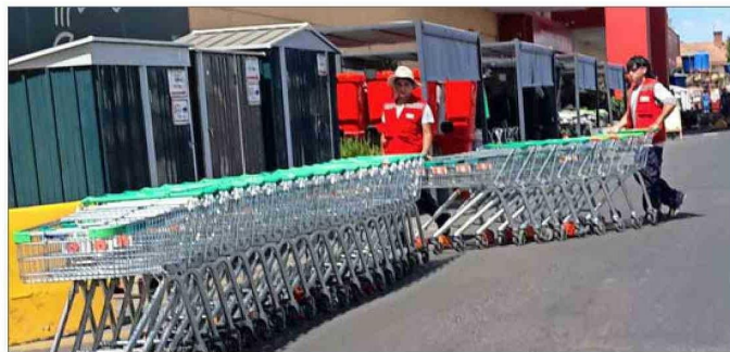
MAULE. — En Talca, trabajadores denominados "carreros" los recolectan para evitar su sustracción.