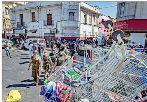
RM. — Una fiscalización detectó una bodega donde se almacenan estos transportes en La Vega Central.

Apela a una campaña en que se retengan los carros que son usados en el comercio ilegal y se devuelvan a sus propietarios. Asimismo, revela que mecanismos como el cobro por su uso o el empleo de alarmas no han re-