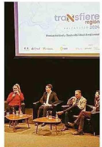
HUBO DIVERSAS EXPOSICIONES.