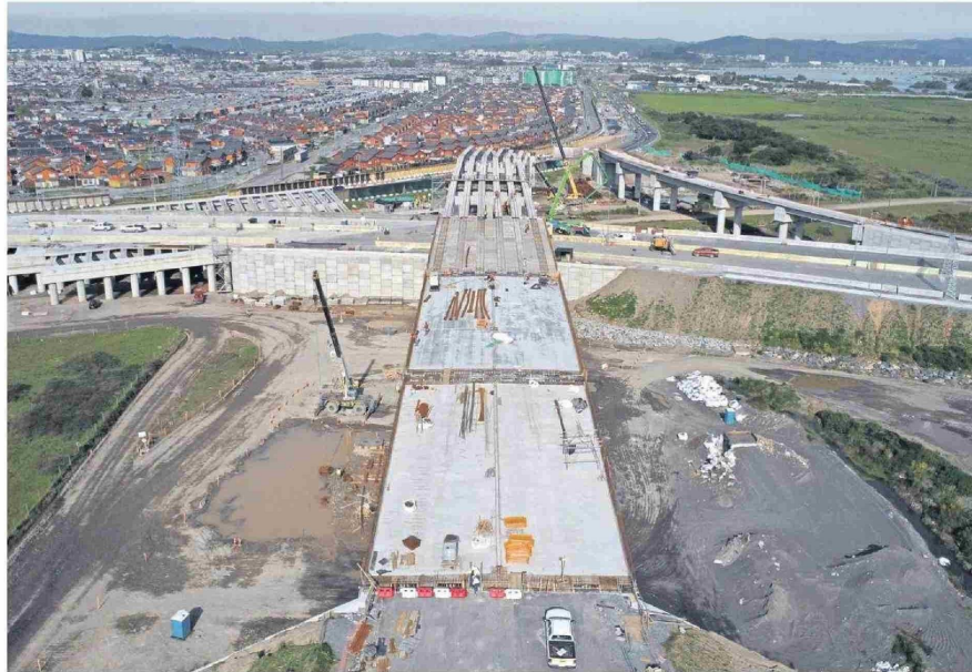
Varias figuras consultadas coinciden en que el nuevo gobernador debe asumir un rol articulador para materializar mayor inversión en la Región del Biobío.

Entre las prioridades más urgentes, identificamos la necesidad de revertir la crisis económica actual mediante políticas públicas que promuevan el cre-