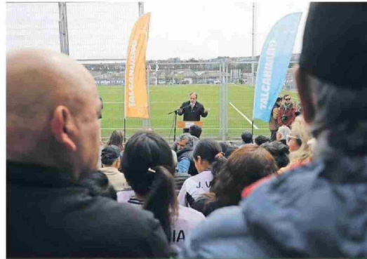
Como idea se propone generar cambios en los tipos de programas que son apoyados por el Gore.

Por lo mismo, asegura que las expectativas son altas respecto al rol de articulación potente que tendrá no sólo con Economía –en materias como la nueva Ley de Pesca o replantaciones forestales–, sino que también con Obras Públicas, “porque como región nos hemos quedado rezagados desde el punto de vista de la modernización de la logística”. Suma a Energía, “donde hay que empujar la modificación de ley de permisos sectoriales, que