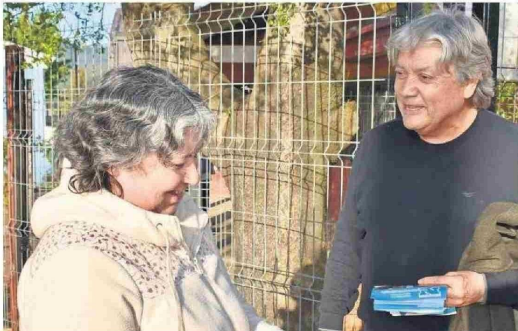
El exenador Navarro es la carta de Regiones Verdes Liberales para ganar el Gobierno Regional.