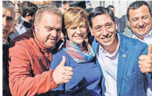
Giacaman, exintendente regional en el segundo gobierno de Piñera, es el candidato de Chile Vamos.