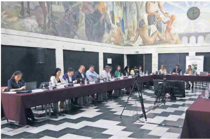
Parte de los consejeros regionales destacan la posibilidad de que la nueva autoridad ejecute una auditoría externa por el caso Convenios.