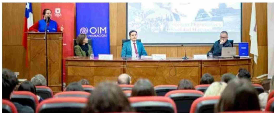
La temática fue analizada en una jornada organizada por la Mesa Intersectorial contra la Trata de Personas en el Maule.

cas humanitarias". "La trata de personas es compleja desde el punto de vista de comprobar que exista y, por lo tanto, a través de protocolos de alertas tempranas, nos permite anticiparnos a los hechos, que esperamos que no sucedan", agregó Leppe.