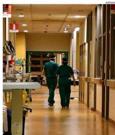
LA DIRECCIÓN DEL HOSPITAL INFORMÓ SOBRE LOS PROCESOS.