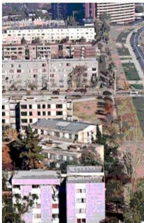
Vista de lo que fue la Villa San Luis antes de que empezara su demolición en 1997.

gración social urbana y buena calidad constructiva, y que contó con varias firmas de arquitectura. En el caso del edificio que sigue en pie –recientemente intervenido para que no se caiga, pero se mantiene inhabitable– fue obra de Luis Emilio Alemparte, así como el que estaba al lado (Block 15), del que solo queda un vestigio. Hecho en hormigón armado, tenía cuatro pisos, un cuerpo de circulación interior, y sus departamentos variaban entre dos y tres dormitorios.