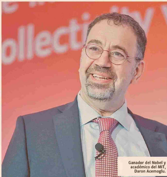
Ganador del Nobel y académico del MIT, Daron Acemoglu.