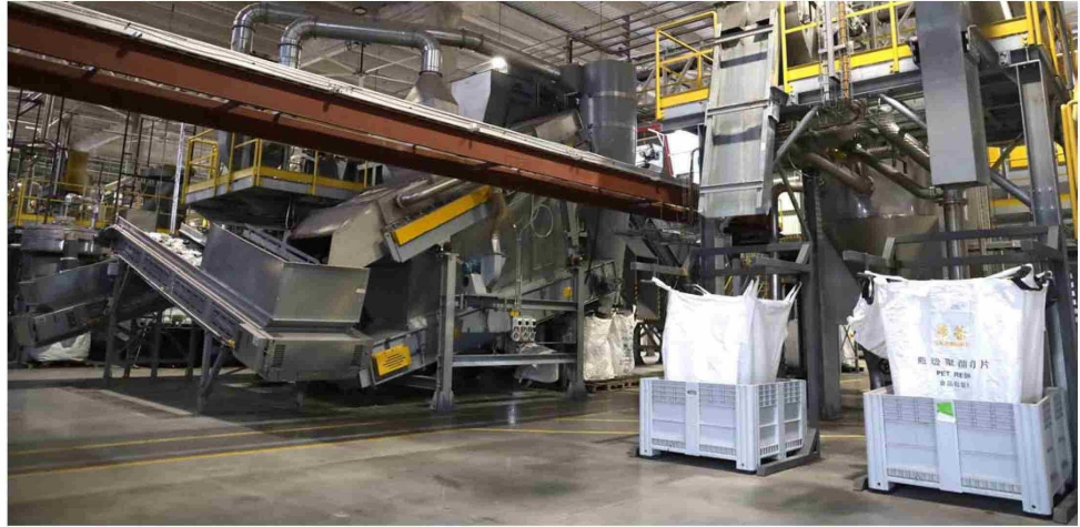
La inauguración de esta planta en Santiago, es un verdadero hito en los esfuerzos que se desarrollan para impulsar la economía circular en América Latina.

Gracias a una inversión de 35 millones de dólares, con esta iniciativa se pretende lograr una reducción significativa de la necesidad de resina virgen en el mercado, ya que se utilizará para dar vida a nuevas botellas.