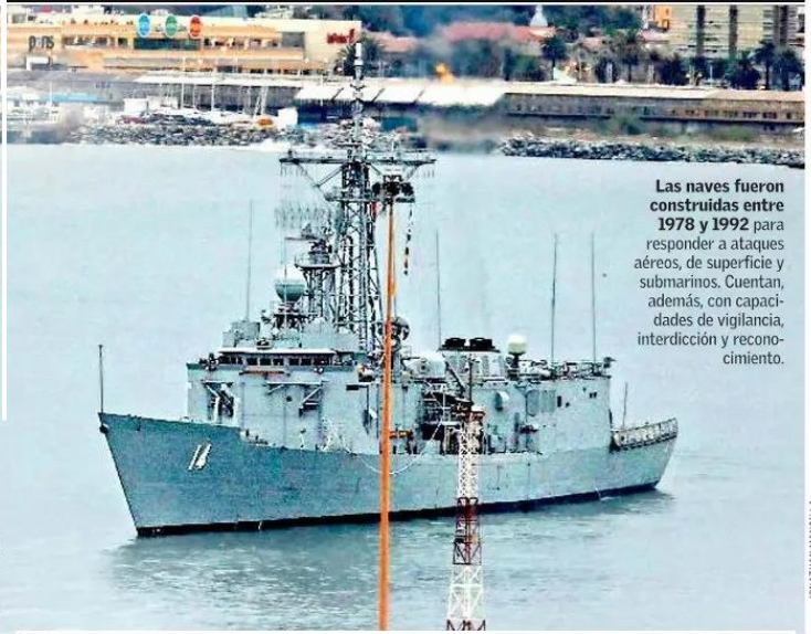
Las naves fueron construidas entre 1978 y 1992 para responder a ataques aéreos, de superficie y submarinos. Cuentan, además, con capacidades de vigilancia, interdicción y reconocimiento.

La adquisición de las dos unidades es parte del proyecto Puente IV de la Armada de Chile para modernizar su escuadra. Ambos buques izaron el pabellón nacional en una ceremonia celebrada en abril en la base naval de Kuttabul, Sídney.