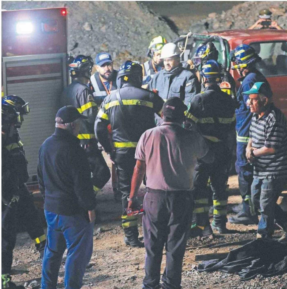
EN HORAS DE LA NOCHE SE ANALIZÓ COMO EFECTUAR EL RESCATE DE LOS CUERPOS.