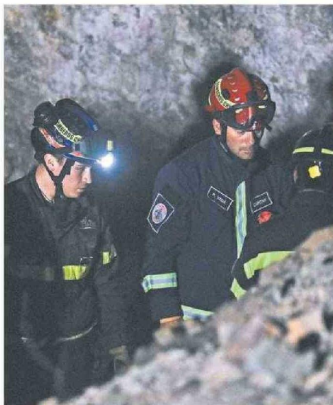
DISTINTOS EQUIPOS DE EMERGENCIA AYUDARON EN LA EMERGENCIA.

concretó, por lo que no se encontraban siendo utilizadas con autorización de la empresa. “Este accidente representa un llamado de alerta para el sector de la pequeña minería para cumplir con la legislación correspondiente y operar bajo todas las medidas de seguridad, con pleno resguardo a la vida de las personas”, sentenció la empresa. CS