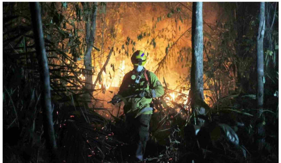
ESTA TEMPORADA ESTIVAL se ha registrado un 19% más de incendios forestales en la provincia de Biobío.

“En relación con lo que se quema, un incendio está compuesto por distintas sustancias: gases y partículas pequeñas que emanan de los materiales que entran en combustión.