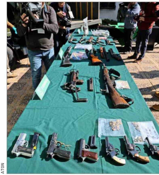
Incautaciones de armas de grueso calibre, y también arrestos, fueron ajustados a derecho, afirmaron en Carabineros y la fiscalía.

También desde SD, el presidente de la comisión de Minería y Energía, Juan Luis Castro (PS), contestó, a favor de Tohá, que “es inaceptable volver a criticar al Gobierno en un tema grave de segu-