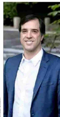
Ignacio Yarur Arrasate, futuro presidente de Bci.