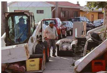
ES CLAVE PARA EVITAR RESIDUOS EN LAS QUEBRADAS.

“Otro eje de acción que contempla este plan es el trabajo comunitario, don-