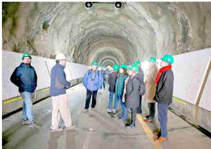
Los asistentes pudieron recorrer las instalaciones del embalse Colbún.