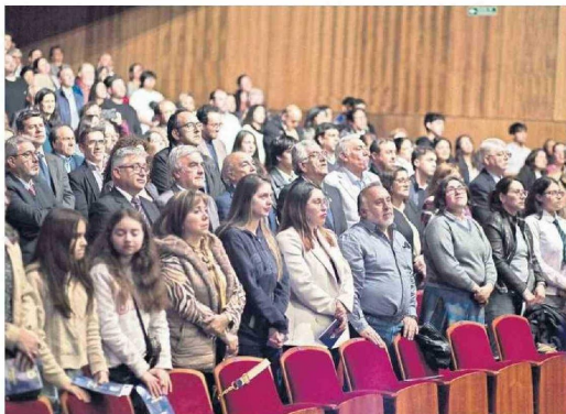
Los asistentes siguieron atentamente las interpretaciones.