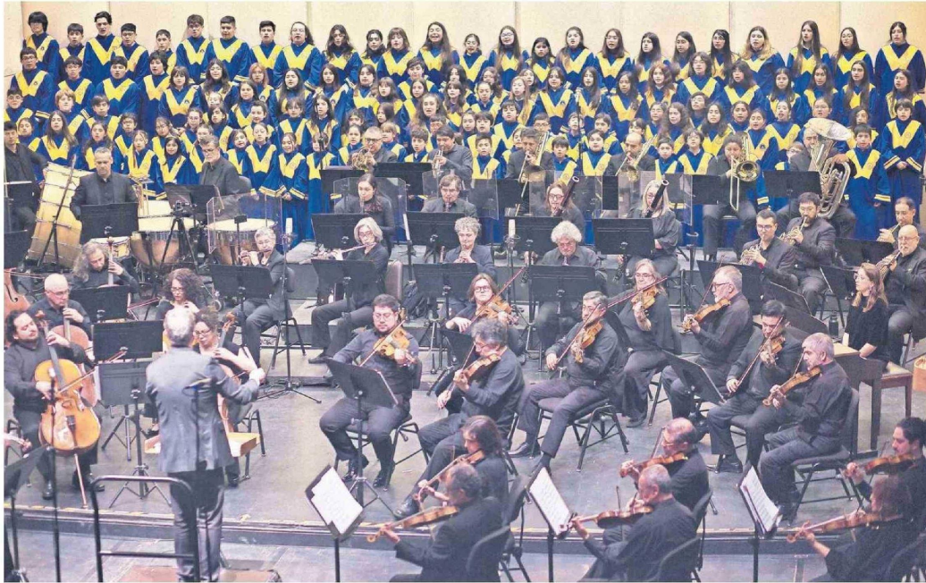
El coro junto a la orquesta UdeC deleitaron al público durante la gala.

Tiraje: 10.000 Lectoría: 30.000 Favorabilidad: No Definida