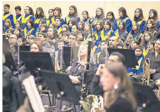
Diferentes piezas clásicas conformaron el repertorio del evento.

La actividad contó con la presencia de más de 500 asistentes, principalmente compuestos por apoderados y las familias de los estudiantes, socios de la corporación, funcionarios y autoridades de COEMCO, quienes se deleitaron con la presentación de