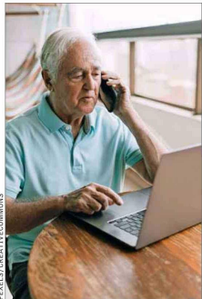
Las llamadas telefónicas son la segunda preferencia para comunicarse, WhatsApp está en primer lugar.

Y añade: “Estamos trabajando para incluir contenido sobre la prevención de fraudes cibernéticos, análisis crítico de la información y navegación segura en internet”.