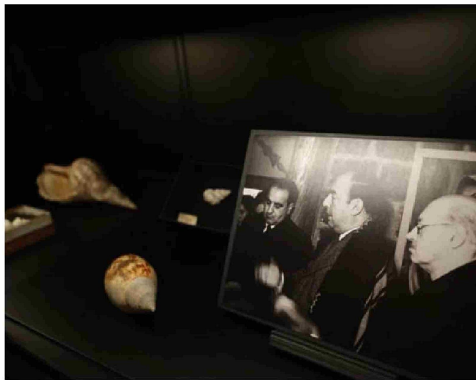
► Colección de caracolas de Pablo Neruda, en la Sala Museo Gabriela Mistral.