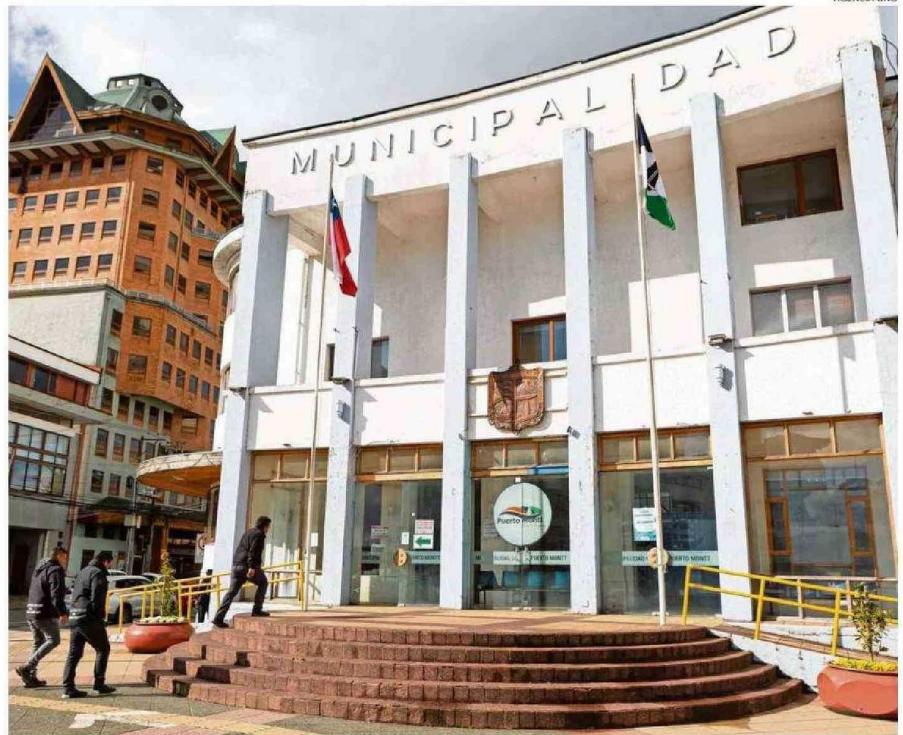
EL CONCEJO MUNICIPAL APROBÓ CON OBSERVACIONES EL PADEM 2025, CUESTIONANDO LA ELABORACIÓN DE UNA LISTA NEGRA DE DESVINCULACIONES.

En cuanto a la matrícula 2025 de los establecimientos educacionales de la comuna, se prevé que se mantendrá la registrada en agosto de este año, que es de 20.253 alumnos. Es-