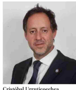
Cristóbal Urruticoechea, diputado