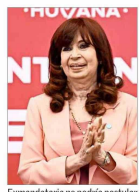
Exmandataria no podría postular por una condena por corrupción, que todavía puede ser recurrida.

LAS CLAVES DEL PROCESO QUE RECIENTE COMIENZA | A 4 EDITORIAL | A 3 COLUMNA DE OPINIÓN | A 2