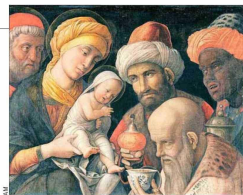
Posiblemente los reyes magos eran sabios entendidos en los astros, venidos de Babilonia. Pintura de Andrea Mantegna.

la repercusión universal del nacimiento de Jesús. Según explicó Benedicto XVI, 'los hombres que llegan de Oriente personifican a los pueblos del mundo, a la Iglesia de los gentiles, a los hombres que a lo largo de los siglos se ponen en marcha hacia el niño de