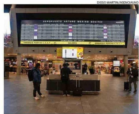
HUELGA INCLUYÓ A 136 FUNCIONARIOS QUE PEDÍAN MEJORAS LABORALES.