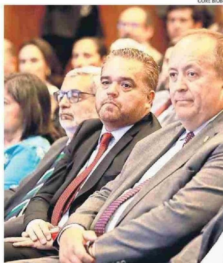
EL GOBERNADOR EN SU PRIMERA ACTIVIDAD COMO AUTORIDAD.

Cristian Aguayo Venegas cronica@estrellaconce.cl