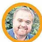
Sergio Giacaman, Gobernador Regional del Biobío

El Biobío vivió este martes el inicio de un nuevo ciclo con el primer día oficial de Sergio Giacaman en su cargo como Gobernador Regional. Una primera jornada cargada de actividades, papeleo administrativo y un corto espacio para socializar con la gente de Concepción.