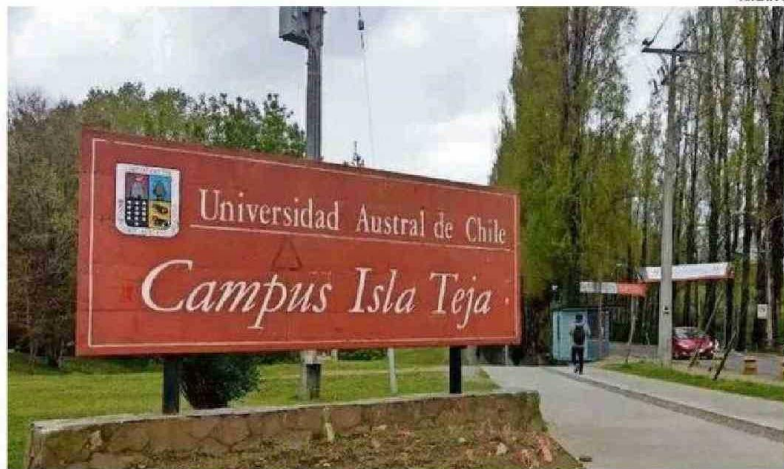
LA CASA DE ESTUDIOS ENFRENTA CRISIS FINANCIERA, LA CUAL ESTA SIENDO ABORDADA JUNTO A LA SES.