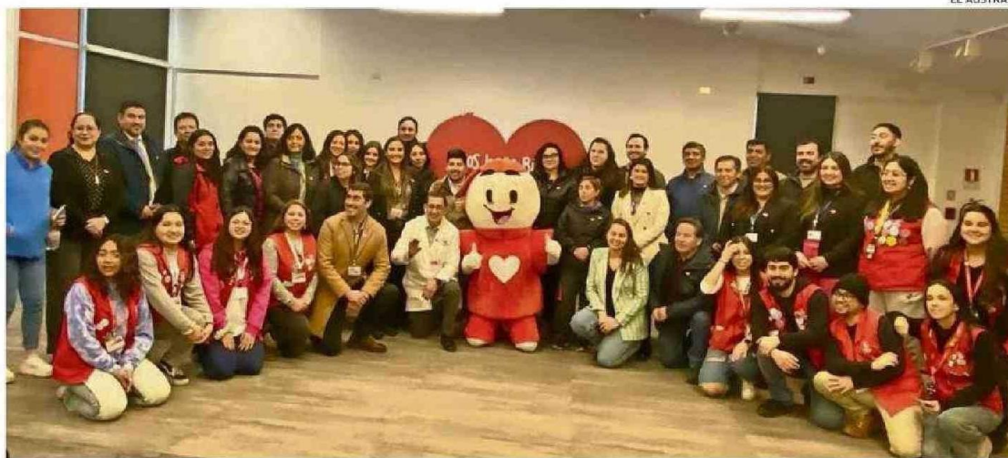
UNOS 25 REPRESENTANTES DE EMPRESAS Y SERVICIOS PÚBLICOS LOCALES PARTICIPARON AYER EN LA CUENTA PÚBLICA DE TELETÓN TEMUCO.

“Estamos desarrollando el programa Gestión e Inclusión que complementa la actividad terapéutica con el desarrollo de capacidades blandas de los pacientes, la autonomía y vincularlos de mejor manera con las redes; también nos permite trabajar más con el cuidador, que es una persona muy importante para la calidad de vida del paciente y para lograr